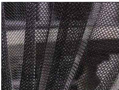
Une façon originale de filtrer la lumière. Cotte de mailles Foin®

Il s'agit d'un assemblage d'anneaux en inox, en aluminium ou en laiton. Chaque anneau est soudé individuellement et relié aux quatre anneaux