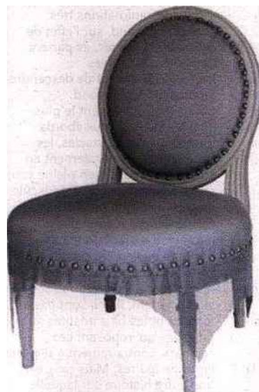
Collection Pierre - odm SL

* L'anodisation est un traitement de surface qui permet de protéger ou de décorer une pièce en métal.